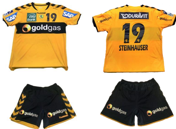
Abbildung 3: Beispiel Werbung auf der Bekleidung der Mannschaften (maximal 8 Werbepartner möglich)