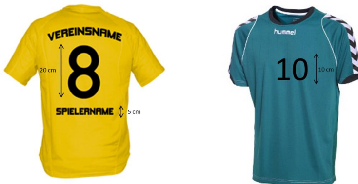
Abbildung 2: Trikot-Beschriftung

Auf dem Trikot muss außerdem der Vereinsname oder das Vereins-Logo angebracht sein. Die Trikotnummern auf den Spielertrikots müssen auf der Brust 10cm hoch und 1cm breit sowie auf dem Rücken 20cm hoch und 2cm breit sein (vgl. Regel 4:8 IHR) (Abbildung 2). Die Trikotnummer muss klar lesbar sein und sich vom Trikot farblich eindeutig unterscheiden.