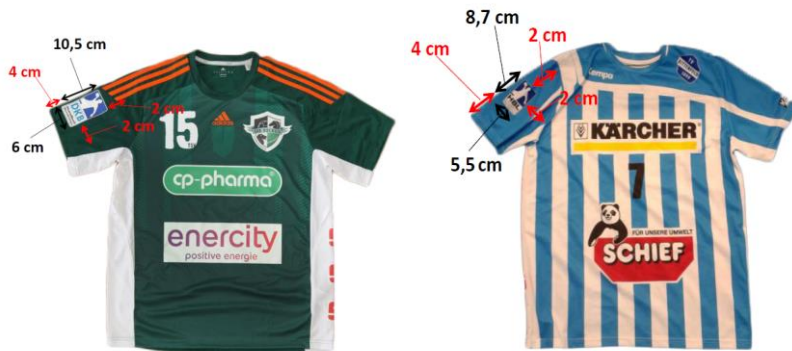
Abbildung 1: Logo Spielertrikot

Andere Veranstaltungslogos (z.B. Champions League Logo) sind auf Trikots, die während der Lizenzspiele, die von der HBL geleitet werden, nicht gestattet.