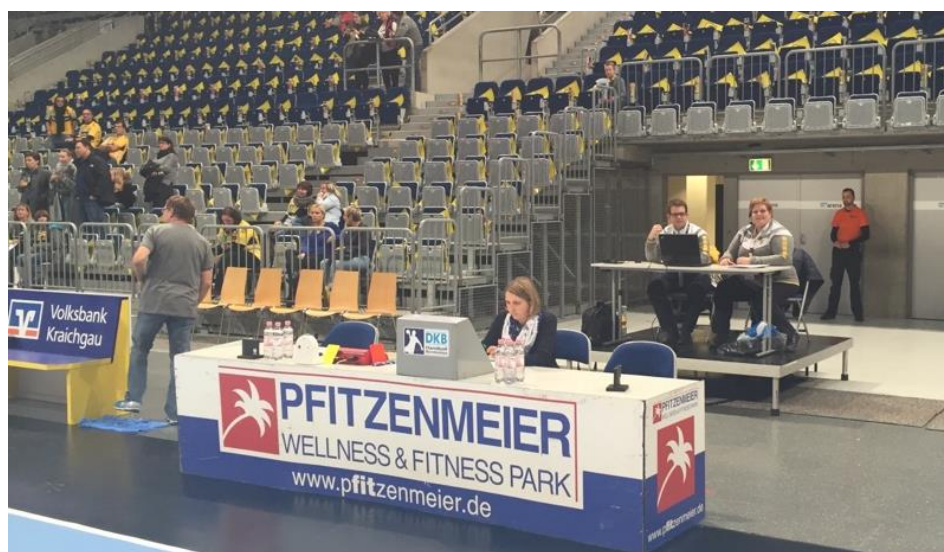
Abbildung 4: Optimale Umsetzung eines Scouterplatzes

Es muss vom Heimverein ein nicht sichtbehinderter Arbeitsplatz in der Halle mit Zugang zum Spielfeld/Kampfericht zur Verfügung stehen. Dieser muss mit einem Tisch sowie einem Strom- und Internetanschluss (LAN – kein WLAN) ausgestattet sein.