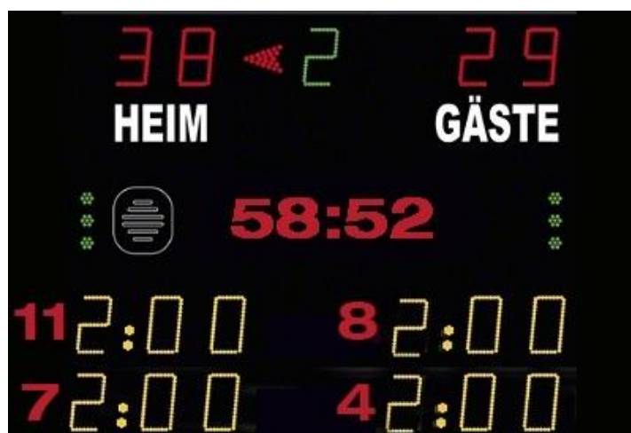
Abbildung 1: Beispiel Anzeigetafel

Das Anzeige-System in der Spielstätte muss eine öffentliche Zeitmessaanlage sein, die von allen Zuschauerplätzen und insbesondere vom Zeitnehmertisch ohne Einschränkungen gesehen werden kann. Auf der Anzeigetafel müssen mindestens zwei Hinausstellungen pro Verein inkl. Spielernummer und Strafzeit (siehe Abbildung 1) angezeigt werden können.