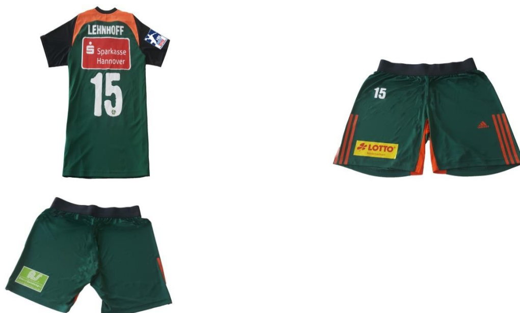
Abbildung 3: Beispiel Werbung auf der Bekleidung der Mannschaften (max. 8 Werbepartner möglich)