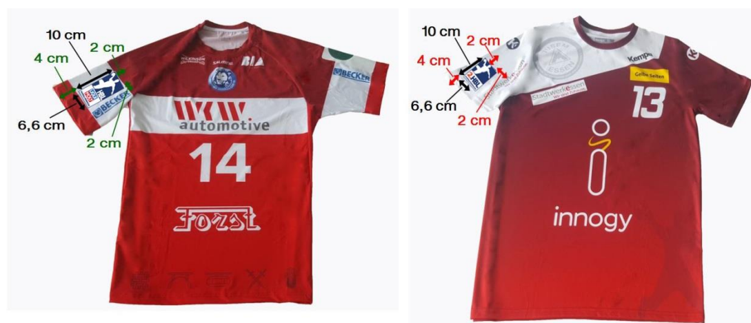
Abbildung 1: Logo Spielertrikot

Das Liga-Logo ist zwingend mittig (unabhängig von Ausrüsterlogos) auf dem rechten Ärmel der Spielertrikots aufzubringen 6,6 cm auf 10 cm, seitlich, nicht auf der Schulter (ganzflächig zu sehen, von der Seite betrachtet)). Das Liga-Logo muss mit einem Abstand von 4 cm zum Ärmelrand angebracht werden. Auf Torwarttrikots ist das Liga-Logo an der entsprechenden Stelle zu platzieren. Um das Liga-Logo herum ist mindestens ein Abstand von 2 cm zu allen Seiten zu anderen Logos bzw. Werbepartnern einzuhalten (siehe Abbildung 1).