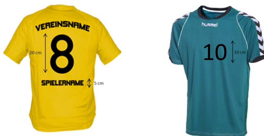
Abbildung 2: Trikot-Beschriftung

Auf dem Trikot muss außerdem der Vereinsname oder das Vereins-Logo angebracht sein. Die Trikotnummern auf den Spielertrikots müssen auf der Brust 10cm hoch und 1cm breit sowie auf dem Rücken 20cm hoch und 2cm breit sein (vgl. Regel 4:8 IHR) (Abbildung 2). Die Trikotnummer muss klar lesbar sein und sich vom Trikot farblich eindeutig unterscheiden.